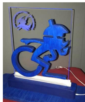
Réalisation de notre plongeur handisub

L'ensemble des activités s'organisant en toute convivialité même si la sécurité est de rigueur dans nos activités.