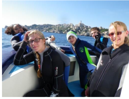
Le groupe, sur le bateau