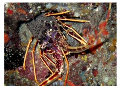
Quelques-unes de nos photos ..... prises lors d'un rallye subaquatique, très belle idée !