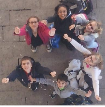
Le groupe, vu du ciel...