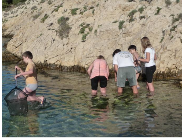
Epuisettes, seaux et pêche à pied