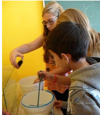
Réalisation de l'aquarium